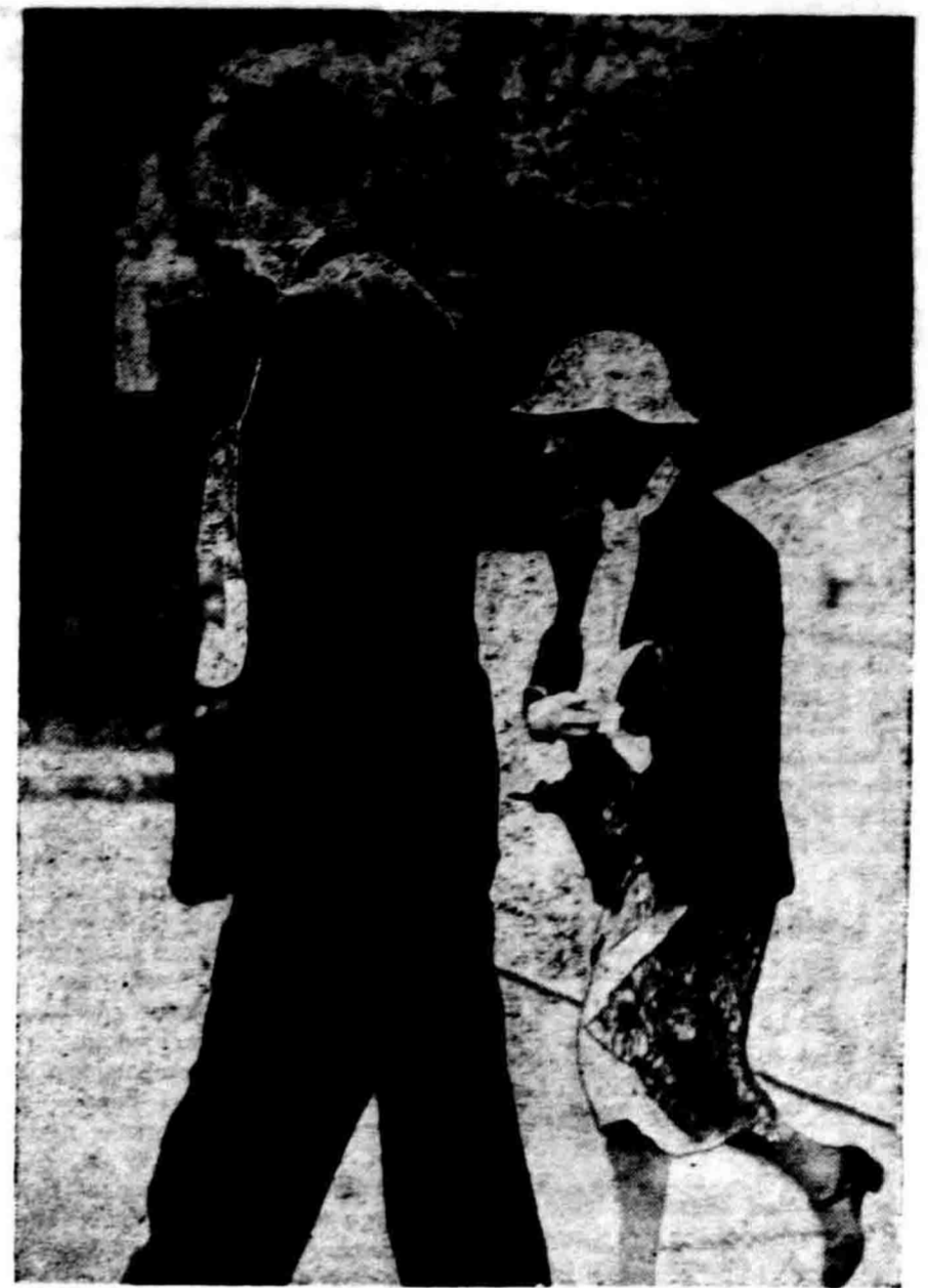
Kolonel Lindberg, djoeroe terbang Amerika (jang sesoedah anaknja ditjoelik pendjahat pindah ke Inggris itoe) sedang berada dilapangan terbang di Afrika Selatan.

Selain dari B.B. ambtenaren, djoega sekalian markmeester di seloeroeh Jawa dikasih instructie soepaja membagikan oeng senan baroe dengan bers. Mereka itoe diwadjabkan oentoeq menaban dan pkerdjaja menjebarkan oeng senan baroe itoe, sebagai tjabang pkerdjajanja. Djoega pihak Algemene Volkreditebank memberikan bantuan oeng jang berbarja dalam pkerdjaja itoe.